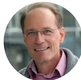
Moderation: Mathias Maurer Redaktion Erziehungskunst