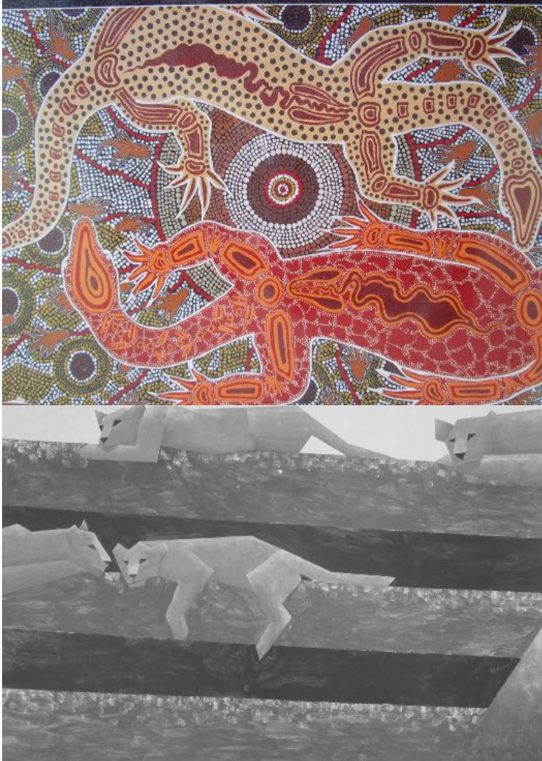
Bild 1: „Male and Female Goannas“ von Russell Saunders Bild 2: „Löwen“ von Mara Reinhart (Schülerin)