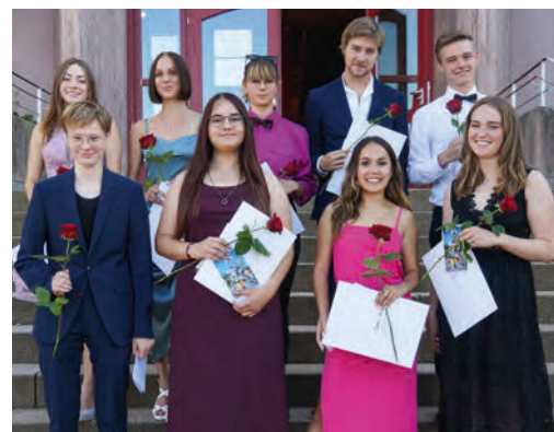
Erfolgreiche AbsolventInnen der Hauptschulprüfung (oben rechts), der Mittleren Reife (unten links) und des Abiturs (unten rechts)