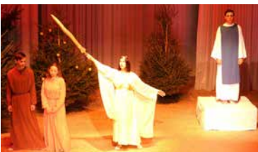
Bilder: Szenen aus Paradeis- und Christgeburtsspiel