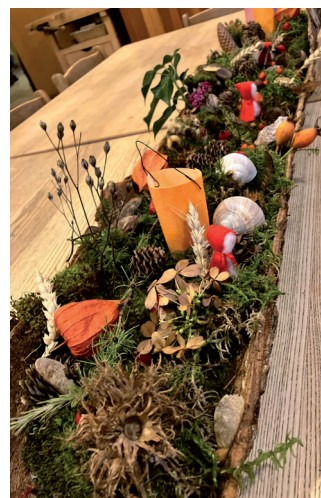
Impressionen vom Martinimarkt