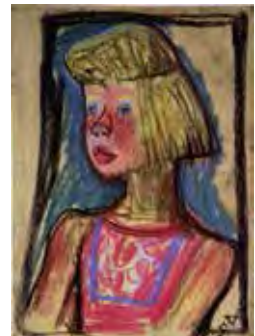
Otto Dix (1891-1969), Mädchenbild, 1952, Pastellkreide