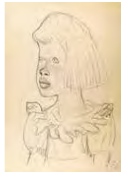
Otto Dix (1891-1969), Kleines Mädchen, 1952, Bleistift