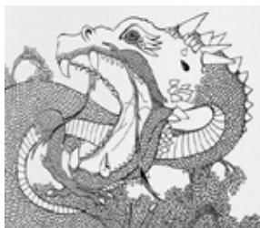
Abbildung: Laleh Torabi, Detail aus der Folge "Sindbad Der Seefahrer", 2012/13, Tusche auf Papier, Collage, Leihgabe der Künstlerin (© bei der Künstlerin)