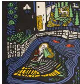
Abb.: Oskar Kokoschka, Titelblatt Die träumenden Knaben, 1906, Lithographie (Kunstmuseum Albstadt)

Für die Titel und Inhalte von Veranstaltungen sind ausschließlich die Veranstalter verantwortlich. Der Waldorfschulverein Zollernalb e.V. veröffentlicht lediglich die Anzeigen. Nähere Infos erhalten Sie über die angegebenen Telefonnummern oder beim Veranstalter.